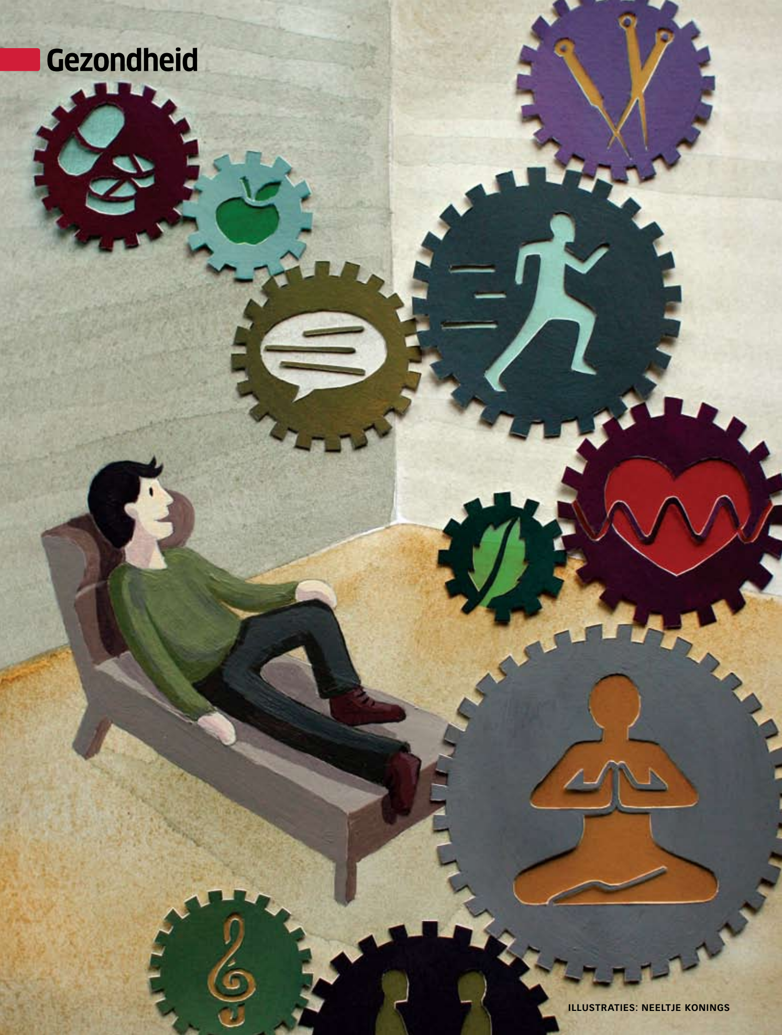
ILLUSTRATIES: NEELTJE KONINGS