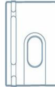
emWave Personal Stress Reliever

Afmetingen: 8,5 x 5,5 x 0.7 cm Gewicht: 62 gram Geïntegreerde oplaadbare lithium ion accu